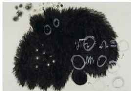
Alicia Vela. El pájaro negro (1990) Óleo sobre papel 70 x 100 cm