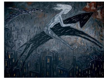
Alicia Vela. Escenarios irreales (1986) Técnica mixta sobre lienzo 200 x 250 cm