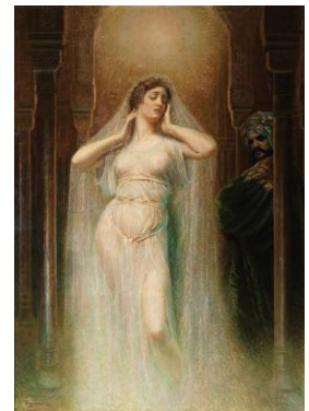
Rogelio de Egusquiza