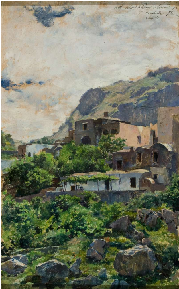
Francisco Pradilla: Paisaje de Capri , 1878, 27 x 17 cm