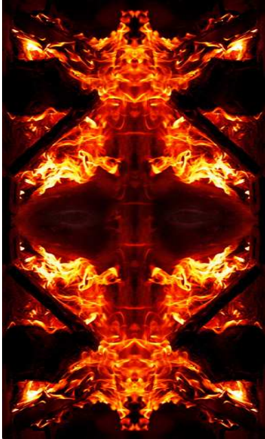
*Incandescente. Paco Simón.